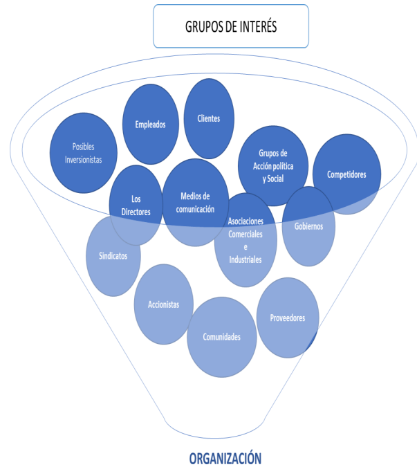
Figura 2. Los grupos de interés in extenso en la organización.